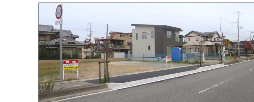
【面積及び販売価格】