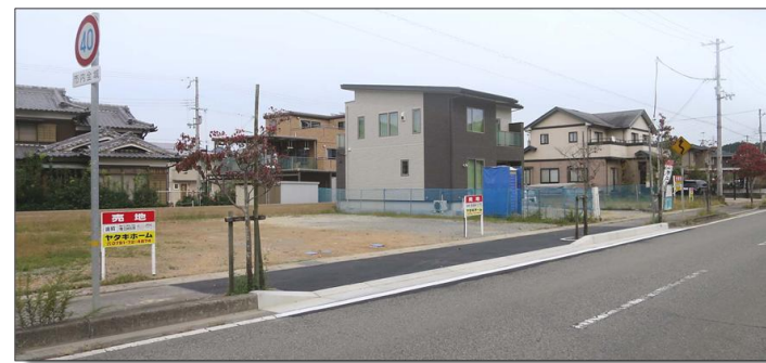
【面積及び販売価格】