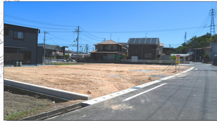
分譲地南西側より撮影